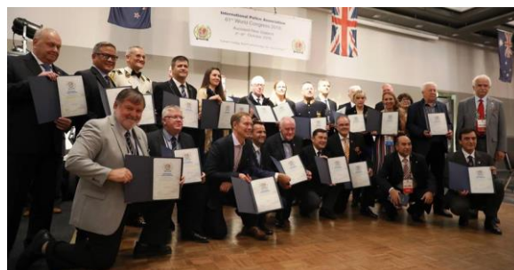
Entrega de Prémios