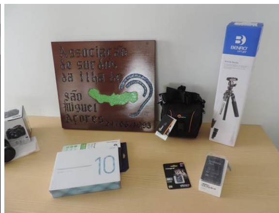
Entrega de equipamentos

No dia 04 de outubro de 2016, na sede da Associação de Surdos da Ilha de São Miguel - ASISM, realizou-se a cerimónia de entrega de equipamento adquirido (frigorífico; máquina fotográfica; tablet e telemóvel) com a verba angariada aquando da realização do VIII Passeio de BTT PSP/CRA Segurança Solidária.