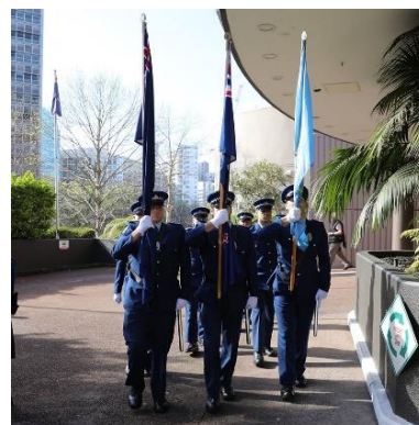
Desfile da cerimónia de abertura

Na prefeitura, a cerimonia contou com a presença do Comandante da Policia da Nova Zelândia, o prefeito da cidade e um representante do Povo Maori, de entre outras entidades. O senhor Comandante da Policia da Nova Zelândia mostrou o seu agrado por receber a grande família IPA no seu País e acolheu-nos com uma mensagem de boas vindas e ótima estadia na cidade das velas.