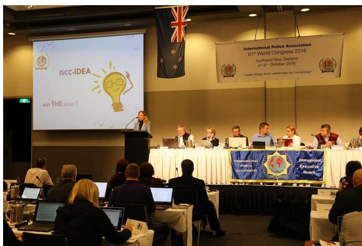
Apresentação da Delegada de Portugal

A comissão cultural e social apresentou diversos projetos dos quais destacamos o novo livro sobre as casas IPA. Este livro, vai permitir de forma atualizada e mais simples, o conhecimento, por parte dos associados, da localização das casas existentes.