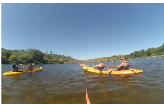
Canoístas no Rio Tejo