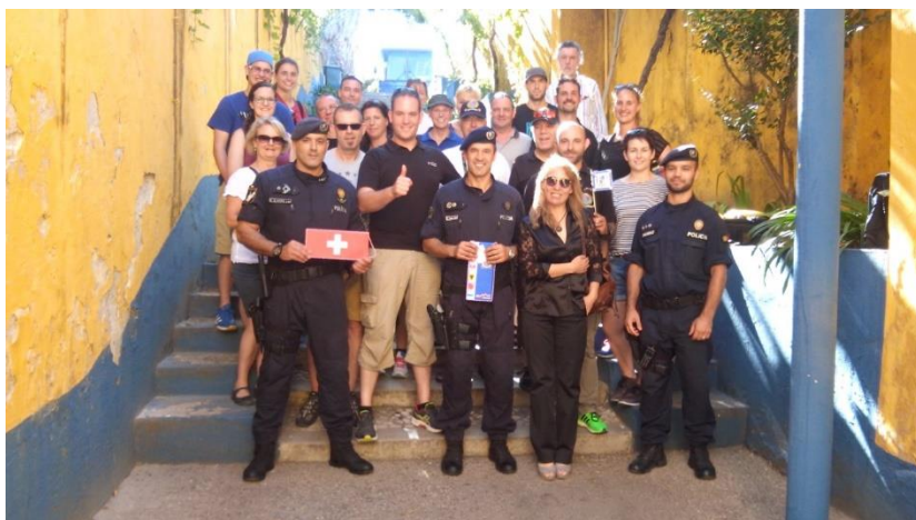
Visita ao Corpo de Intervenção da PSP