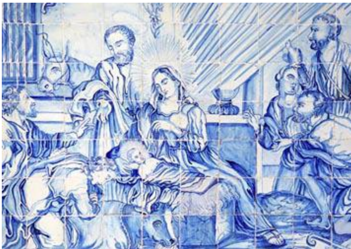
A TRADIÇÃO QUE NOS DISTINGUE - AZULEJARIA PORTUGUESA