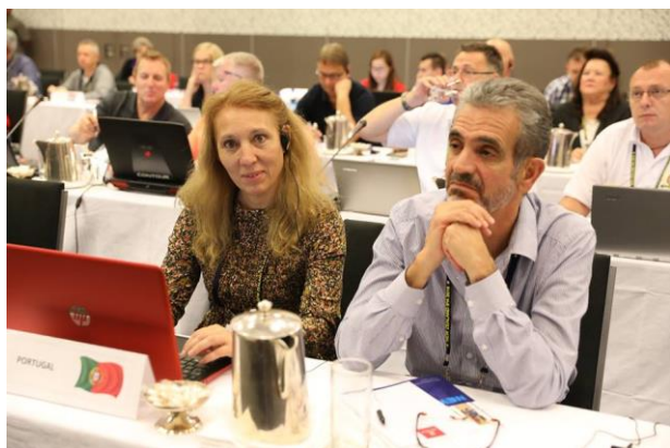
Delegada e observador de Portugal

Os congressistas votaram a suspensão de Moçambique até ao próximo congresso, uma vez que essa secção não se encontra ativa. Foi possível evitar a suspensão do Brasil que também se debate com problemas internos. Portugal ficou responsável pela mediação e tentativa de resolução do problema do Brasil e a Suazilândia de Moçambique.