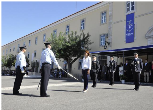
Guarda de honra