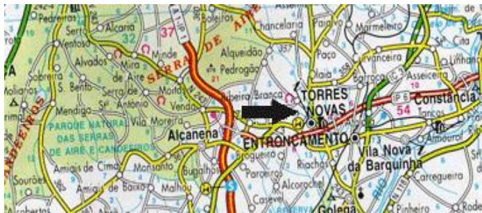
Escola Prática de Policia