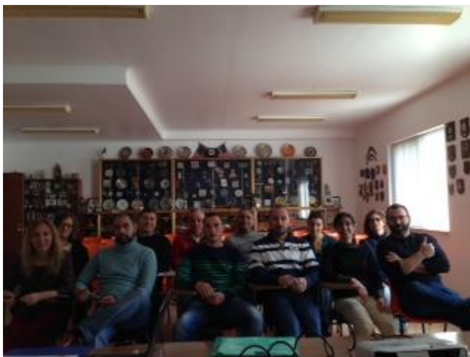
Grupo de Formandos e formador