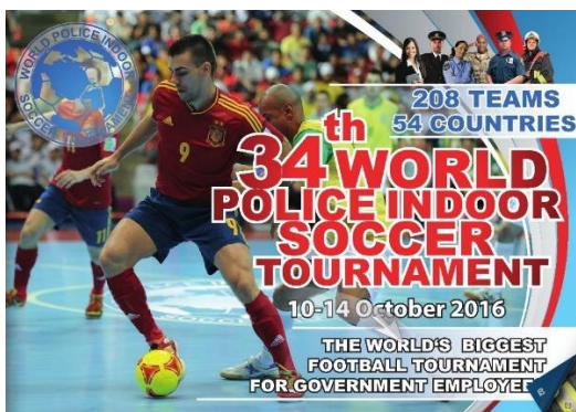
Cartaz de Promoção do evento