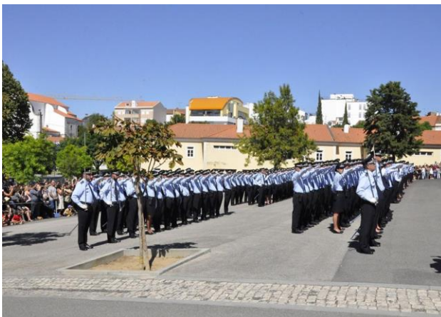
Compromisso de Honra

Em nome da IPA apresentamos cumprimentos e desejamos felicidades e os maiores sucessos a todos os profissionais que iniciaram as suas funções, bem assim como à instituição.