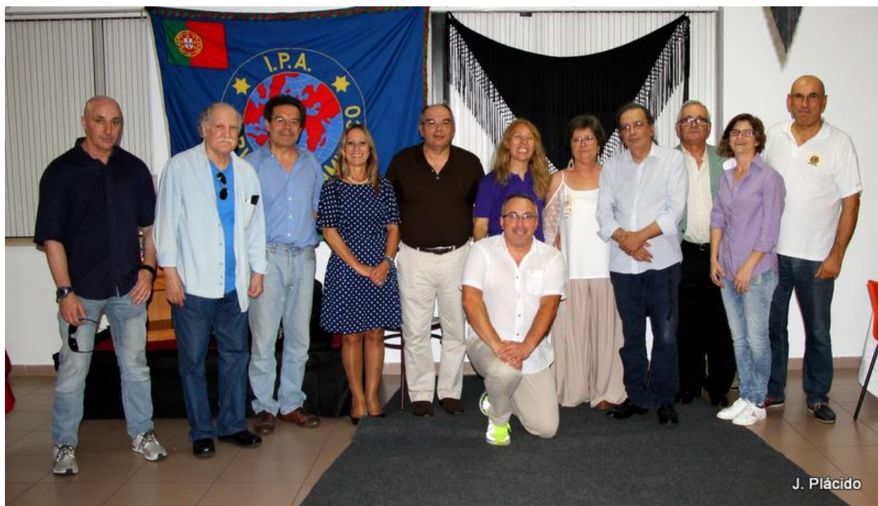
Fadistas, Instrumentistas e Organização

A todos que colaboraram na organização do excelente evento os nossos parabéns e muito obrigado.