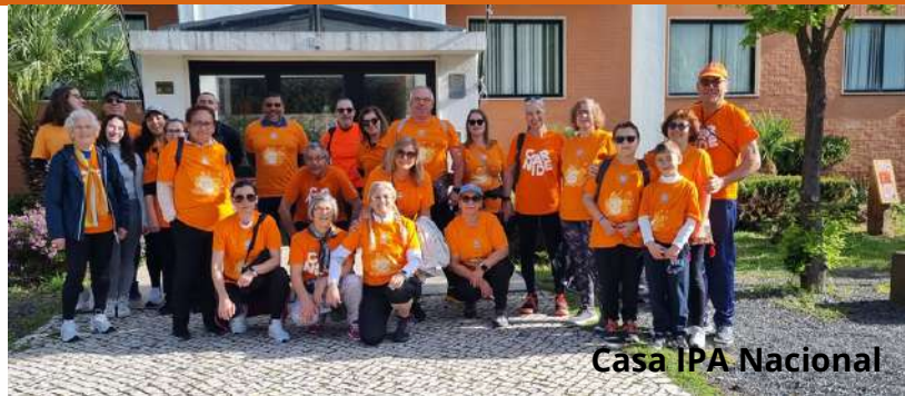
Casa IPA Nacional