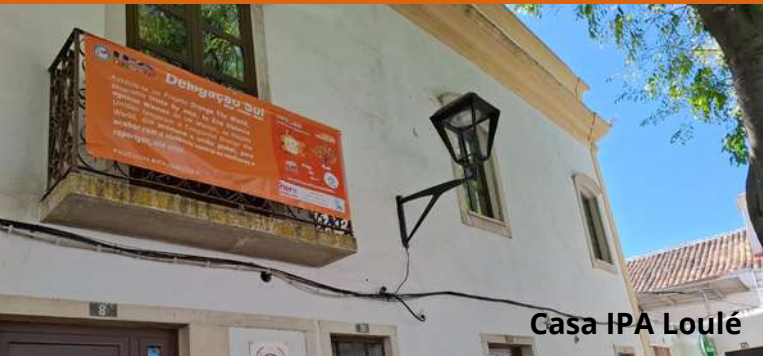
Casa IPA Loulé

O Boletim Informativo da Secção Portuguesa da IPA