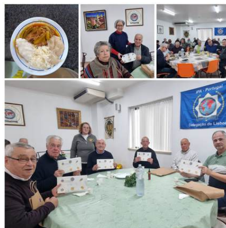
Almoço Dia 19MAR2025 Moamba de Galinha O Dia do Pai foi lembrado

Vem saborear os nossos requintados pratos Aguardamos a tua companhia.