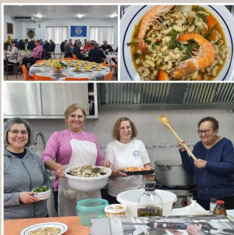
Almoço Dia 12MAR2025 Massada de marisco

A Delegação de Lisboa, tem vindo semanalmente a presentear os associados com os saborosos pratos e sobremesas da gastronomia portuguesa. Às pessoas que tornam estes encontros em momentos de partilha o bem haja.