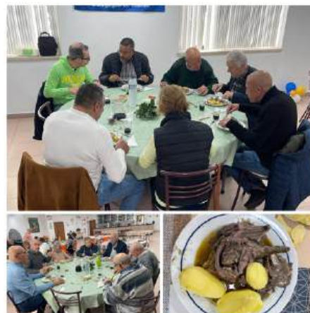
Almoço Dia 5MAR2025 Coelho à caçador