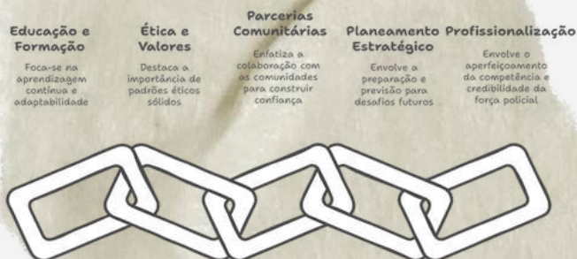
Fig. 2 - A construção de uma liderança policial de referência

O contexto atual de “modernidade líquida” (Bauman, 2007) e as demandas sociais plurais intensifica a necessidade de líderes que conciliem autoridade legal e a colaboração comunitária. A velocidade das transformações sociais e tecnológicas exige uma formação ao longo da vida, com ênfase na capacidade de adaptação e gestão de crises, além de um sólido referencial ético (Felgueiras S. , 2024). Iniciativas como as de Portugal ilustram caminhos possíveis, demonstrando como a profissionalização e a educação avançada podem fortalecer o prestígio e a eficiência das forças policiais (Felgueiras & Morgado, No Prelo).