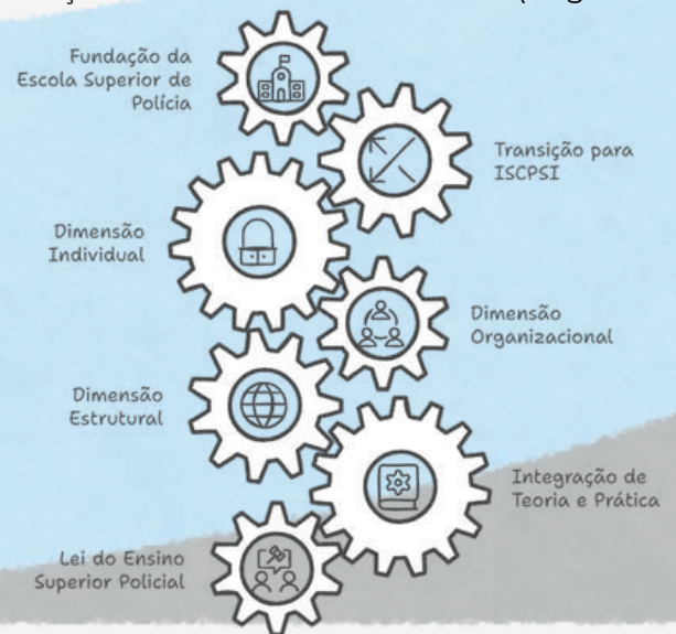
Fig. 1 - Marcos na evolução da educação superior policial em Portugal

A integração de teoria, prática e reflexão crítica foi fortalecida pela adoção de conhecimentos especializados nas áreas de comando, de administração policial e de gestão estratégica (Paterson, 2011). A Lei do Ensino Superior Policial (Decreto-Lei n.º 13/2022, 12 de janeiro) trouxe, ainda, avanços, como a criação do Conselho do Ensino Superior Policial (CESPOL) e a expansão de unidades de ensino politécnico, promovendo elevados padrões de educação e inserção no quadro nacional de qualificações.