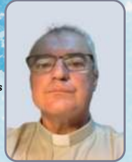
Padre António Borges Capelão da GNR

No ano de 2025, a Peregrinação Militar e Policial Nacional a Fátima ocorrerá nos dias 5 e 6 de junho.