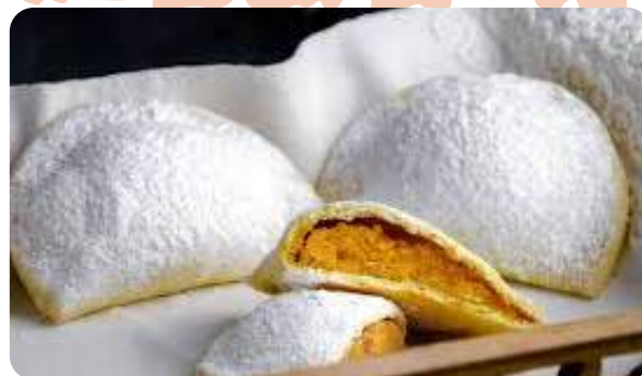
Pastéis de Santa Clara