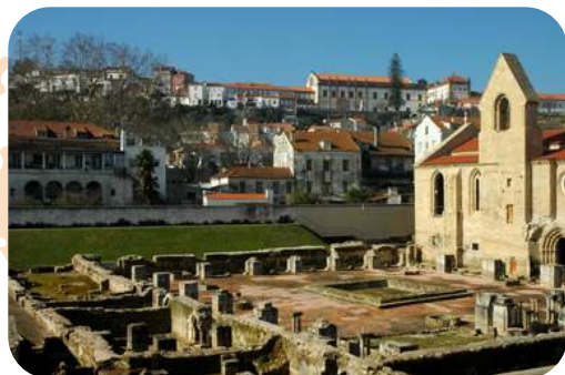
Monastério de Santa Clara-a-Velha: