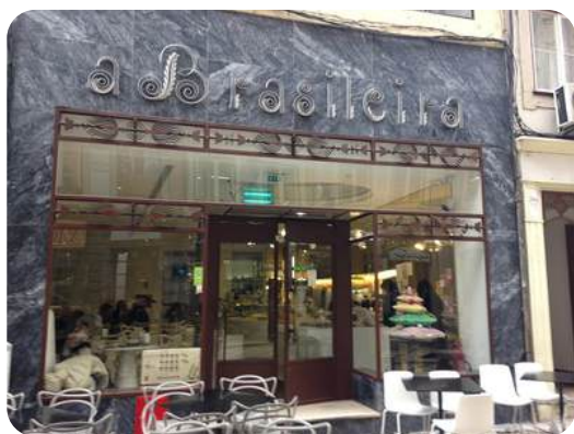
Café A Brasileira