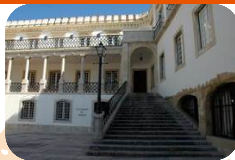
Universidade de Coimbra