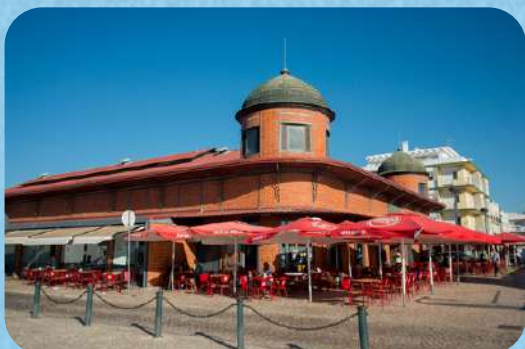
Mercado de Olhão