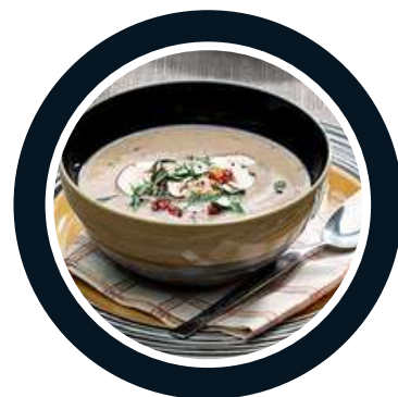
Sopa de Castanhas